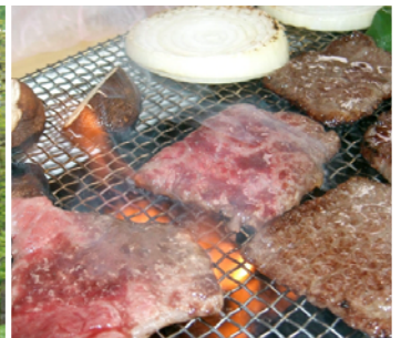
写真は全てイメージです

ツアーの内容につきましては、沙流ユーカラ街道活性化協議会より委託されている下記までお問合せ下さい。